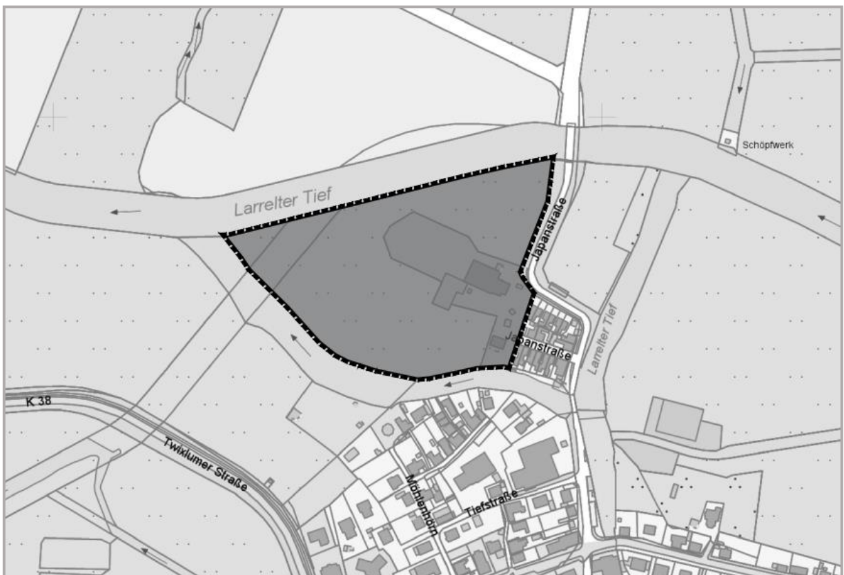
Abbildung: Übersichtsplan mit Geltungsbereich des Bebauungsplans D 168

Der räumliche Geltungsbereich ist im folgenden Übersichtsplan geometrisch eindeutig festgelegt.